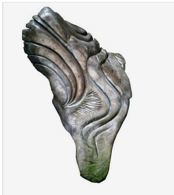
"Universo das Esferas"

Aí, então, começa o projeto de materialização. Uma longa gestação, na qual, eu e a obra somos um. Muitas vezes percebi a aurora fundir-se ao crepúsculo. Muitas noites não dormi e em muitos outros dias não comi. A vida artística é pura renúncia.